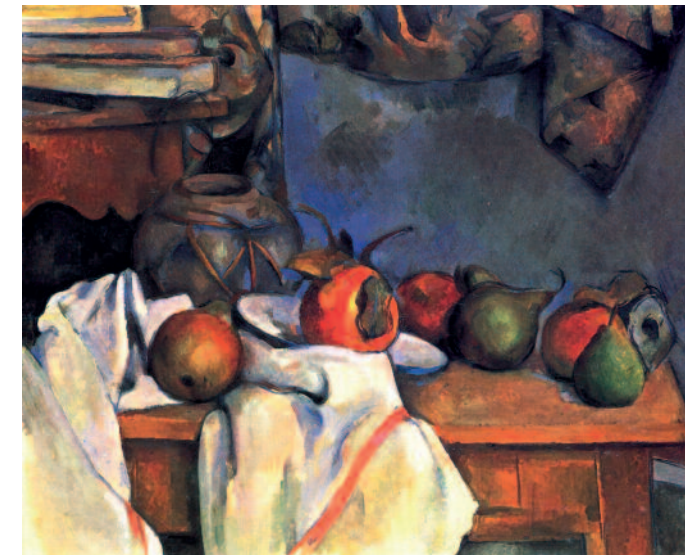
Paul Cézanne, Stilleben, Ingwertopf, 1893